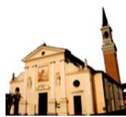
SAN MARTINO V.